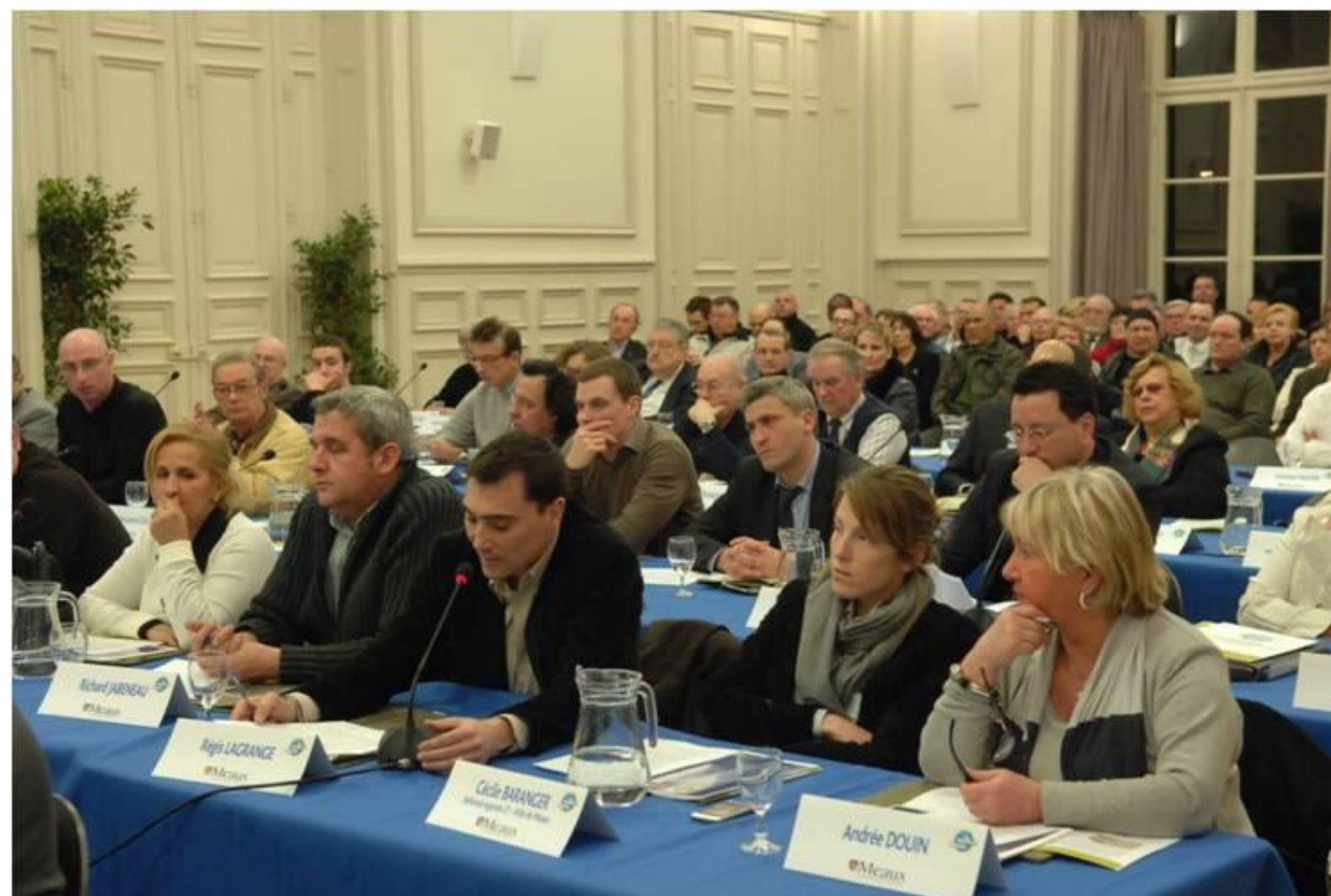
The Sustainable Development Council, a meeting place of exchange about sustainable development topics integrated in the Agenda 21 of the city