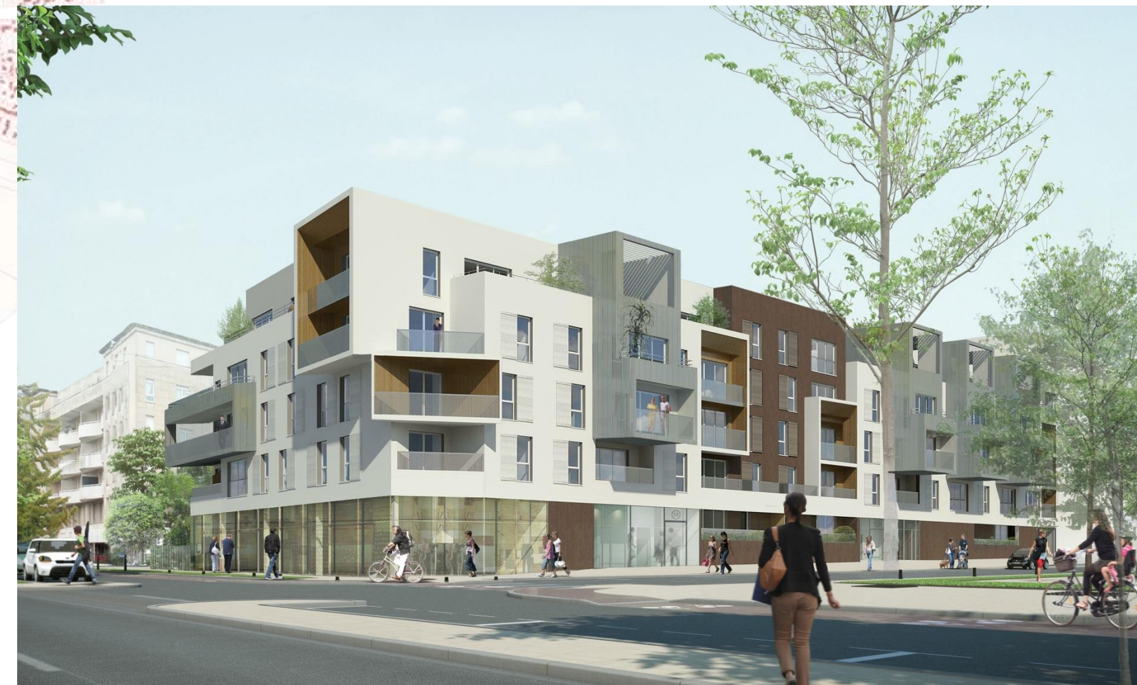
Examples of new eco-friendly buildings in the eco-district