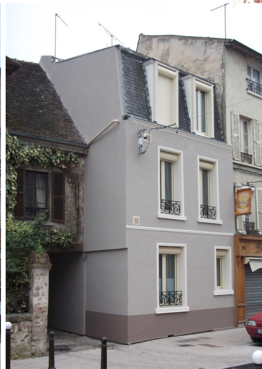
Example of works : insulation from the outside of a small building in the old center (2013)